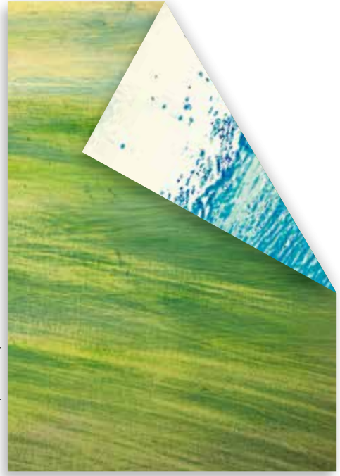
Katrín Roth, GREEN FIELD #030718 (Ausschnitt), 2018, Öl auf Karton, 70×50 cm, © VG Bild-Kunst, Bonn 2019, Foto: K. R.