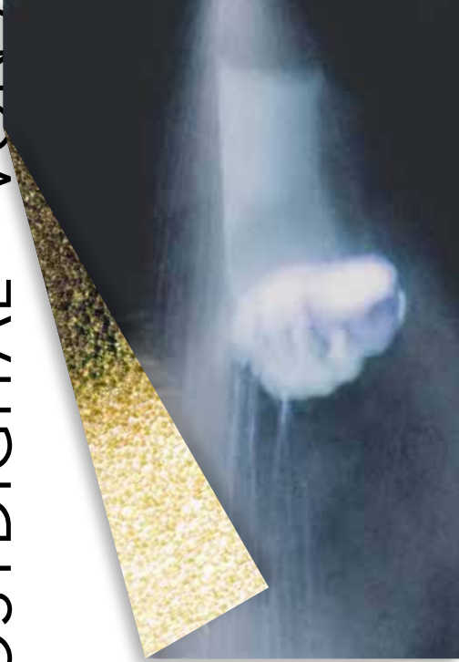
Frank Homeyer, AU (Ausschnitt), 2016, Performance, Fotografie, Foto: Bea Homeyer